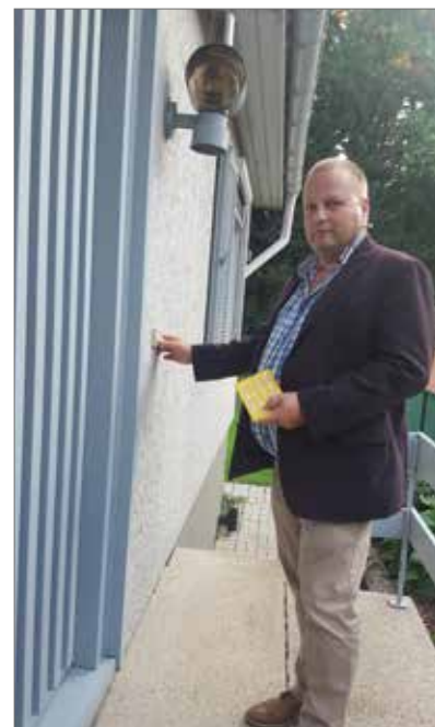
▲ De burgemeester en schepenen belden al 3 000 keer aan in onze gemeente. En het einde is nog niet in zicht.

De ronde was en is een erg grote tijdsinvestering voor onze burgemeester en zijn medewerkers, maar dat heeft nu al zijn rijkdom aan kennis opgebracht. Misschien komen we de volgende weken ook langs in uw straat. U krijgt enkele dagen voor het bezoek een kaartje in de bus. Zo kan u tijdig uw vragen of suggesties voorbereiden. Mocht u echter nu al met vragen zitten, dan kan u ons altijd bereiken via mail of telefoon.