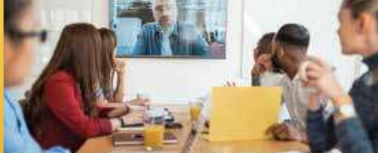
De raad van alle burgers (p. 2)