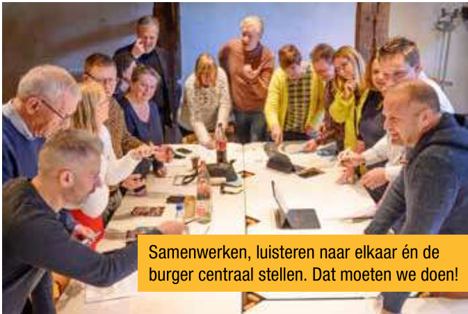
Samenwerken, luisteren naar elkaar én de burger centraal stellen. Dat moeten we doen!

Als wij na de gemeenteraadsverkiezingen aan zet zijn, willen we voor elk gemeenteraadslid een gelijkwaardige stem. De gemeenteraad moet opnieuw het belangrijkste beslissings-orgaan van de gemeente worden, terwijl in de praktijk nu het college van burgemeester en schepenen de beslissingen neemt. De burger moet centraal staan in het beleid, vandaar onze raad van alle burgers .