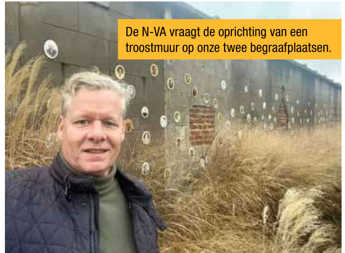
De N-VA vraagt de oprichting van een troostmuur op onze twee begraafplaatsen.