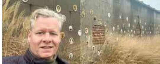
De N-VA vraagt een troostmuur op onze kerkhoven (p. 5)