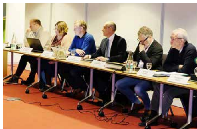
▲ De N-VA-fractie in de gemeenteraad legt elke maand heel wat punten op tafel.

Op dat alternatief voorstel kwam geen antwoord. Met grote verbazing stelden we vast dat het gemeentebestuur ervoor koos om, nog voor het verstrijken van de afgesproken termijn, het eigen voorstel al promoveerde in de pers en via de communicatiekanalen van de gemeente.